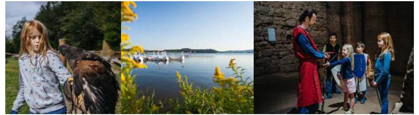
Naturwildpark Freisen, Bostalsee, Ritterführung Historisches Museum Saar